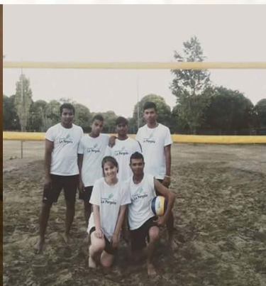
Squadra di pallavolo, La Pergola 2015