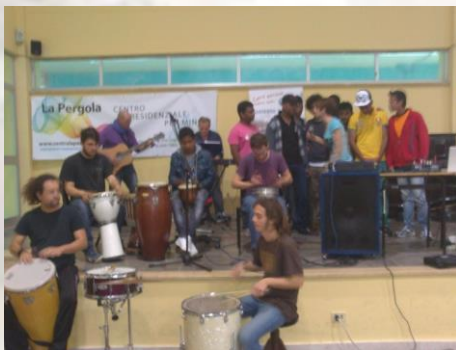
Teatro Ghione, Roma 2012 Apertura del Mundialito