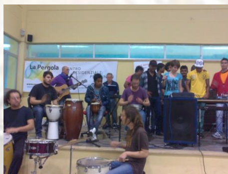
Festa dell'Intercultura – Liceo Maiorana – Città di Latina