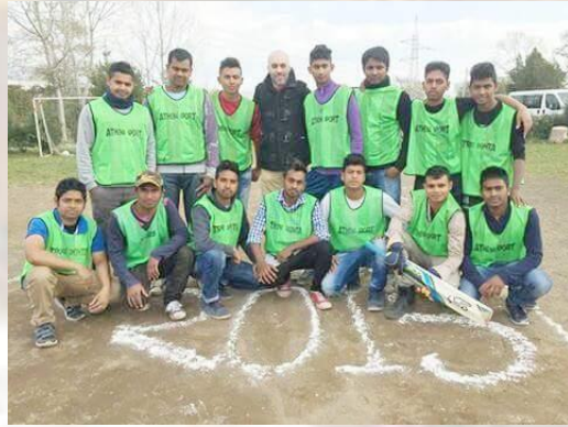
Torneo di cricket, La Pergola, 2015