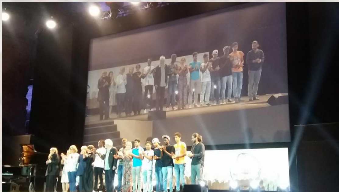
Basilica di Massenzio, Festival delle Letterature, 14 Luglio 2016

Massezio, al festival delle Letterature nel Luglio 2016. Per il 2017 il progetto è in espansione con un nuovo spettacolo inedito.